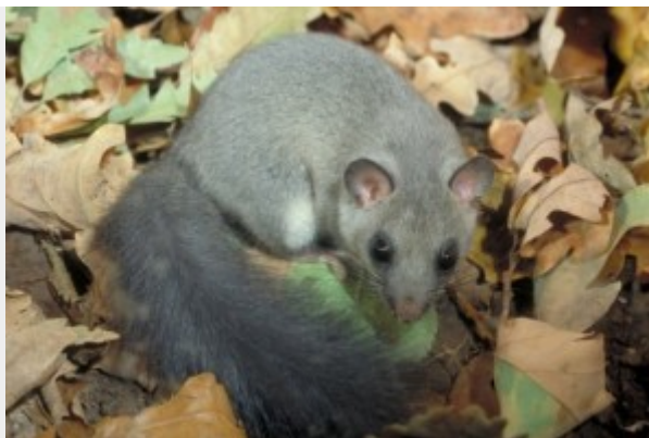
Ghiro glis glis

Tra gli strumenti che i cittadini avranno a disposizione per partecipare attivamente alle campagne di Citizen Science di CSMON-LIFE e dei suoi stakeholder, vi è anche una app per la segnalazione di specie target. Il sistema è pubblico e accessibile online e permette ai cittadini (previo consenso sull'uso dei dati personali) di contribuire alla conoscenza e tutela della biodiversità del nostro paese. I dati, una volta validati da esperti del settore, andranno ad arricchire i database del Network Nazionale della Biodiversità (NNB), un sistema di banche dati nazionale promosso dal Ministero dell'Ambiente, della Tutela del Territorio e del Mare. Basta individuare una specie target, scattare la foto e inviare la segnalazione.