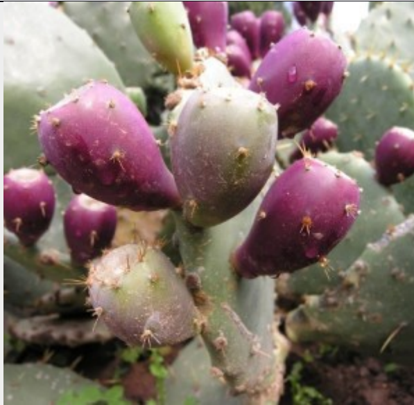
Università di Trieste, Opuntia ficus indica

all'elaborazione di efficaci strategie di conservazione della biodiversità. Quella che si sta profilando in Italia, anche grazie al progetto CSMON-LIFE (Citizen Science MONITORing), è una fattiva collaborazione tra cittadini, istituti di ricerca e istituzioni. La Citizen Science, infatti coinvolge i cittadini anche nello sviluppo di politiche ambientali condivise, e quindi intrinsecamente più efficaci. Inoltre, è uno strumento estremamente efficace nel modificare i comportamenti delle persone che, comprendendo i problemi ambientali e partecipando alla loro soluzione, diventano maggiormente consapevoli del loro ruolo nell'insorgenza di queste problematiche.